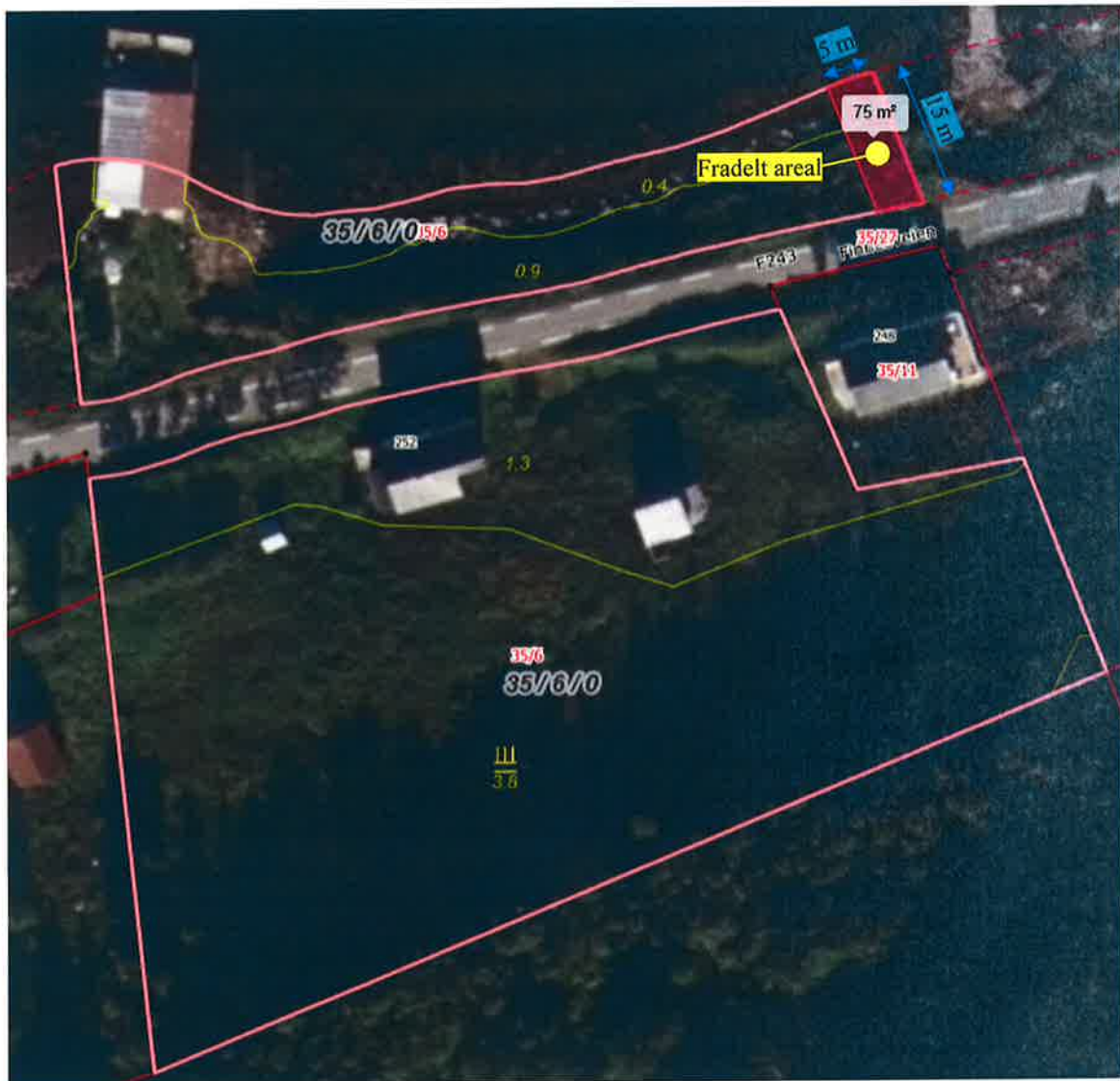
Flybilde gårdskart: Fradelt areal

Eiendom 35/6 som eies av Sevald Eivind Pettersen består av areal ca. 6,4 dekar, fordelt på en teig mot sjøen og en teig sør for fylkesveg 243. Dekar er en offisiell norsk måleenhet (1 dekar = 1000 m 2 ). Omsøkt nausttomt på 75 m 2 mot nordøst av eiendom 35/6 er på situasjonsplan avgrenset av eiendomsgrensen til sjø, fylkesvegen og eiendom 35/7. Fradelt areal på 75 m 2 som er ca. 5×15 m er målt og inntegnet på flybildet under, men skal følge dagens eiendomsgrense til sjø mot nord, eiendomsgrensen til fylkesvegen mot sør og eiendom 35/7 mot øst. Ifølge matrikkelen er eiendom 35/6 fra før av bebygget med en enebolig, garasjebygning og naust.