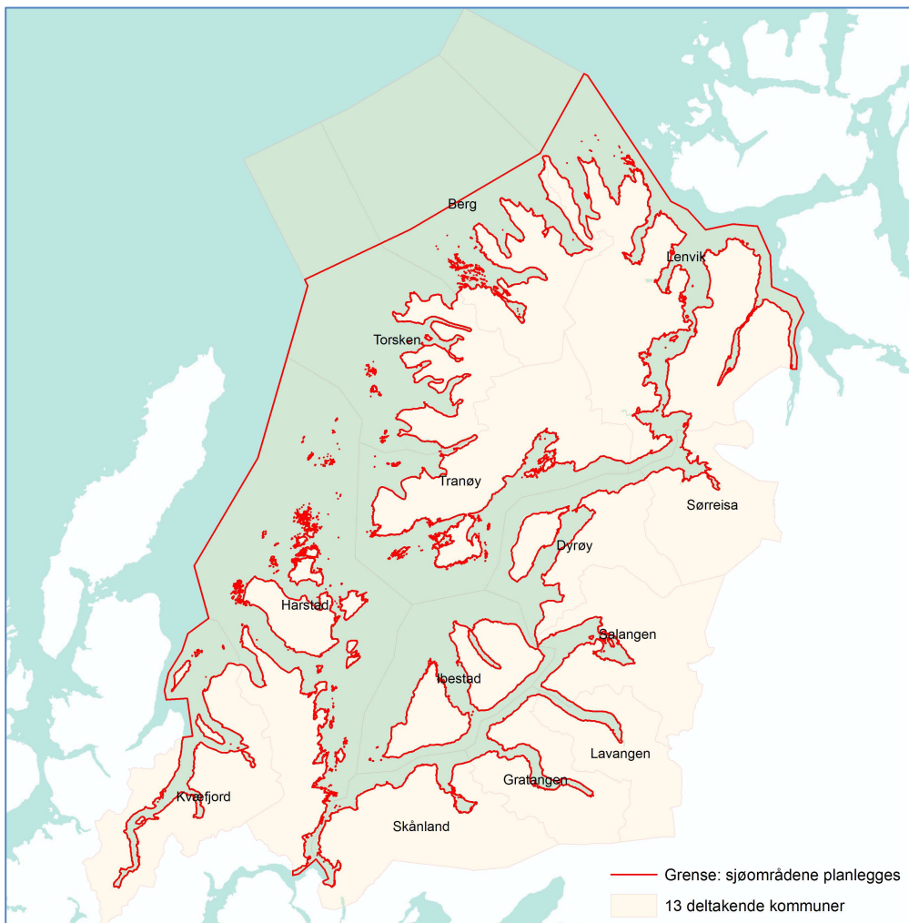
Figur 2. Kart over planområdet. 13 kommuner i Midt- og Sør-Troms er med i plansamarbeidet. Grensen er tegnet som en rød linje i kartet og kan ses i detalj på prosjektets nettside. Den ytre grense er en nautisk mil utenom grunnlinjen og grensen mot land går ved generalisert felles kystkontur.

Området som planlegges dekker sjøarealene i 13 kommuner; Berg, Dyrøy, Gratangen, Harstad, Ibestad, Kvæfjord, Lavangen, Lenvik, Salangen, Sørreisa, Torsken og Tranøy. Sjøområdenes ytre grense er en nautisk mil utenfor grunnlinjene (iht. PBL § 1-2), mens grensen mot land er definert ved "generalisert felles kystkontur" som er en kystkontur utarbeidet av Kartverket i 2008-2011. Grensen går ved midlere høyvann. Se det zoombare kartet på prosjektets nettsider for å se grensen mer detaljert. ( www.strr.no/kystplan )