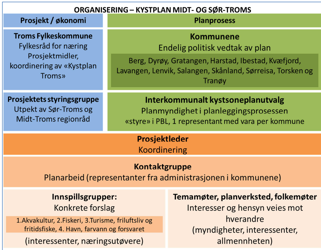
Figur 3. Organisering av prosjektet Kystplan Midt- og Sør-Troms. De blå feltene til venstre gjelder prosjektorganisering (ansvar for personellressurs, økonomi og overordna tidsplan), mens politisk ansvar for planleggingen ligger i de grønne feltene til høyre. Praktisk arbeid med fremstilling av planprogram og plan ivaretas i de oransje feltene under.

Mer informasjon om rollefordeling og organisering finnes i bildet under og i ansvarstabellen i vedlegg 1.