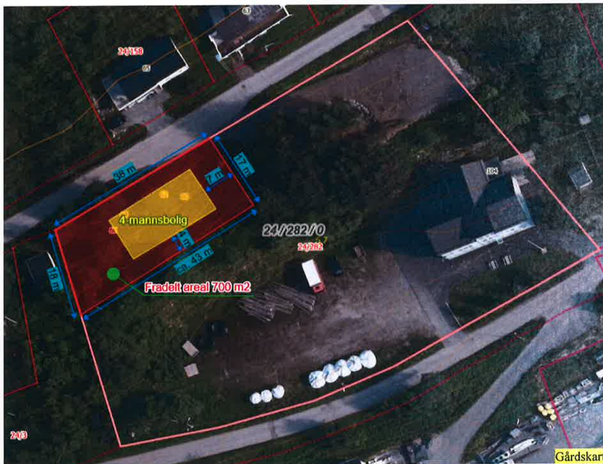
Flybilde: Fradelt areal

På eiendom 24/282 er det registrert automatisk fredet kulturminne art Bosetningsaktivitetsområde, men det er sørøst for fradelt areal.