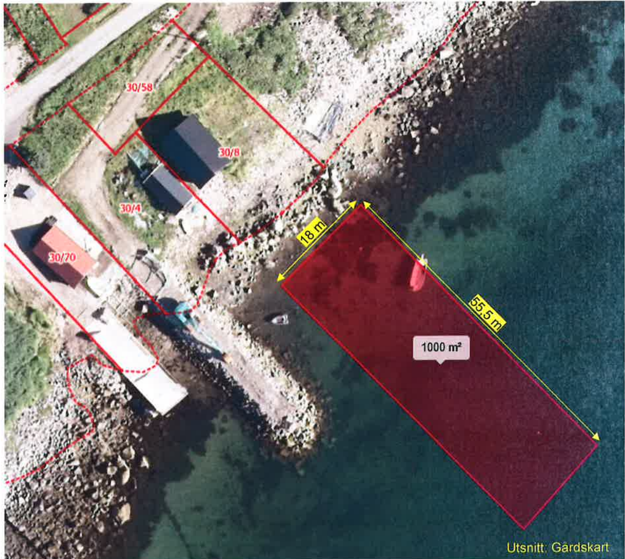
Flybilde tatt år 2016: Fradelt sjøareal