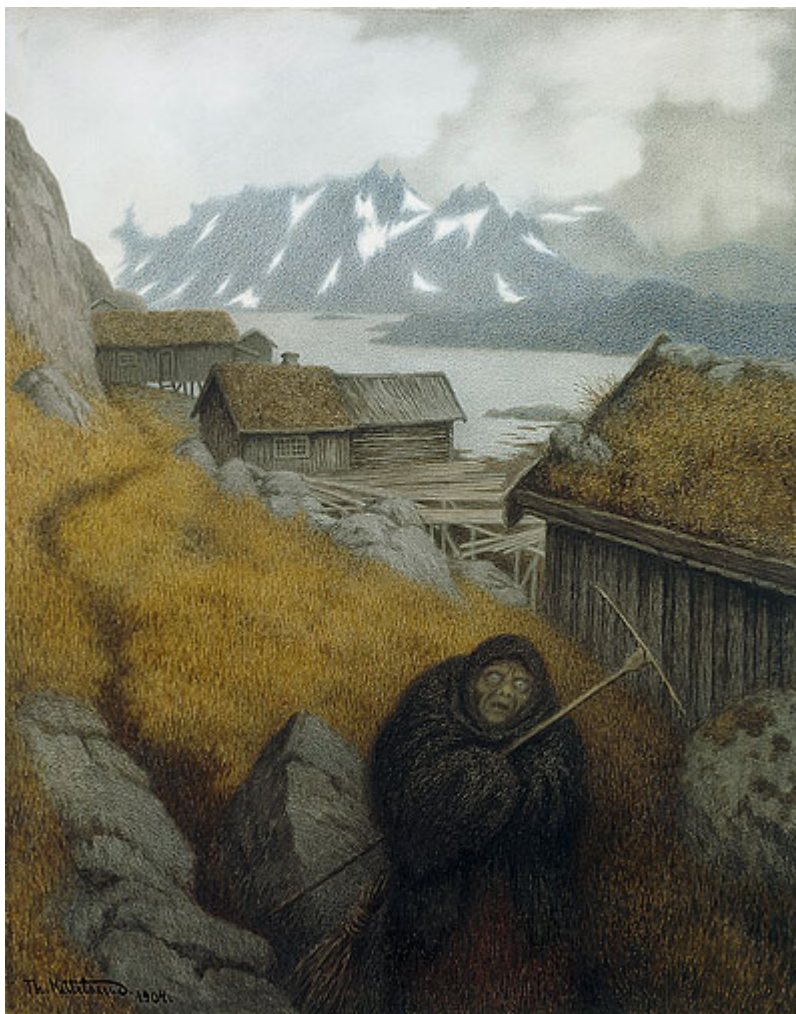
”Pesta farer landet rundt” Theodor Kittelsen 1904

Godkjent av kommunestyret 23.09.2008/vedtak K-SAK 62/08